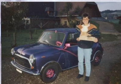
1992 Lilian Lüthi Mini 1100 Spezial