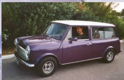
1999 Pascal Ramseier Mini 1275 Kombi