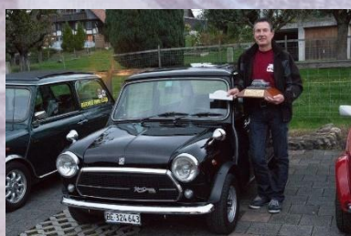
2019 Hans Schenk Mini Innocenti Cooper 1300