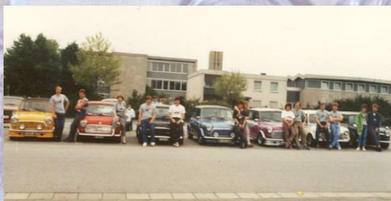
Zum ersten Mal an einem IMM (86- Rüsselsheim/D)

Seit 1986 hat unser Club an jedem Nationalen und Internationalen Mini-Meeting mit einer mehr oder weniger grossen Delegation teilgenommen.