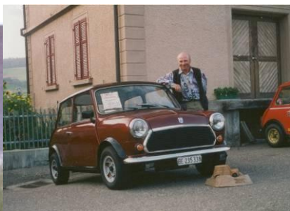
1995 Heinz Wenger Mini 1100 Spezial