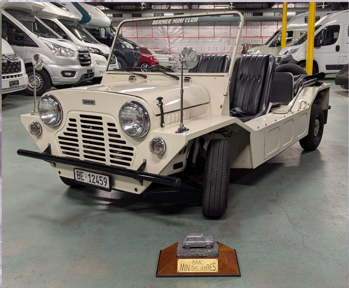
2025 Damian Jäggi Mini Moke