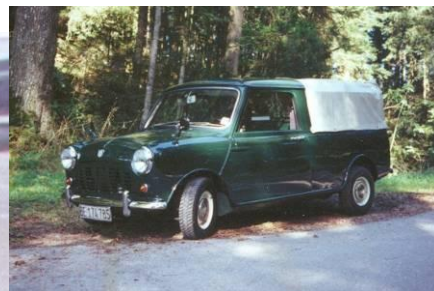
1997 Daniel Bognesi Mini 850 Pick-Up