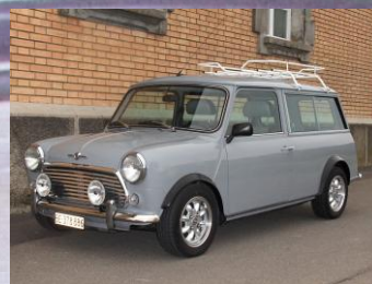
2012 Daniel Bolognesi Mini Kombi 1300