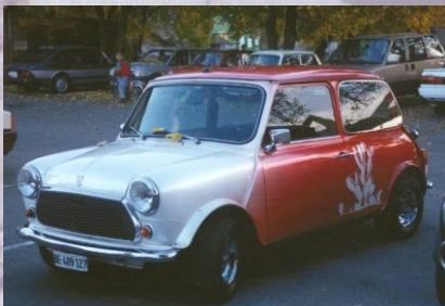
1989 Susanna Wenger Mini 1100 Spezial