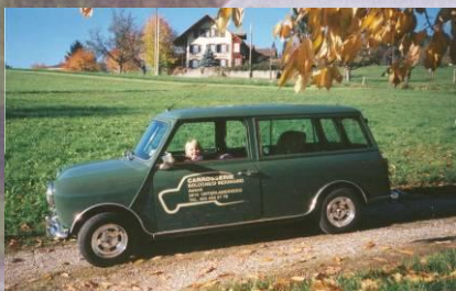
1998 Bernhard Bognesi Mini 1100 Kombi