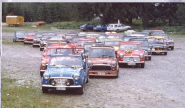
Treffen am Schwarzsee 1980

Den 20. Geburtstag des Mini (1979) feierte man mit einer Fahrt über den Brünig. Der Höhepunkt war das Treffen am Schwarzsee 1980 mit den Mini Clubs aus Luzern und Neuenburg. Dabei waren 20 Minis aus Affoltern, 14 aus Luzern und 6 aus Neuenburg dabei! Ein Jahr später wurden zum ersten Mal Club T-shirts (blau, rot, weiss und schwarz) mit eigens entworfenem Clubsignet gedruckt.