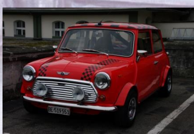
2008 Beat Röthlin