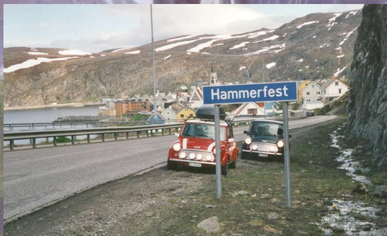
Der Mini läuft und läuft....(2000 – Saariselkä/Fi)