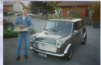
1994 Kuno Müller Mini 1100 Spezial