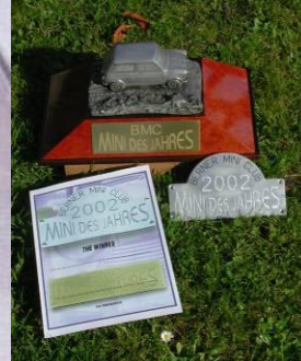
Pokal ab 03 mit Urkunde und Jahresrallyschild