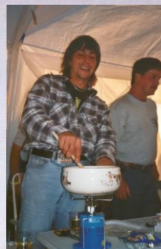
Swissfondue à la Campinggas (Gaydon 99)