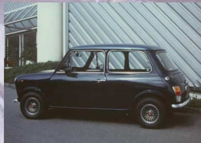
1990 Rolf Kopp Mini Innocenti Cooper 1300