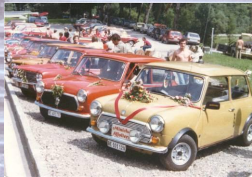
Ausflug ins Simmental 1982

Aus diversen Gründen nahm dann die Mitgliederzahl bis Mitte der Achtziger Jahre stetig ab: