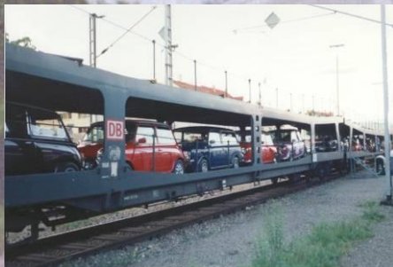
Manchmal mit dem Zug oder aber auch mit dem eigenen Lastwagen