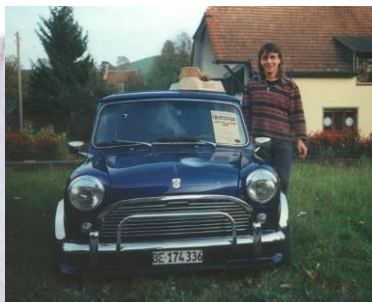
1996 Rene Steinmann Mini 1100 Spezial