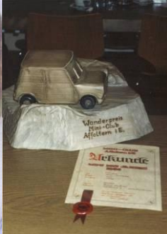
Pokal 86 – 02 mit Urkunde

Seit 1986 wird anlässlich der Hauptversammlung der schönste Mini (=Mini des Jahres) durch die Mitglieder gewählt. Der Sieger erhält für ein Jahr einen Wanderpokal sowie eine Urkunde und ab 2003 noch ein „Mini des Jahres Rally Schild“.