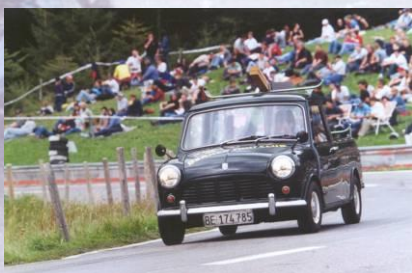
Demofahrten am Gurnigel Bergrennen 03