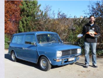
2015 Stefan Feldmann Mini Clubmann Estate