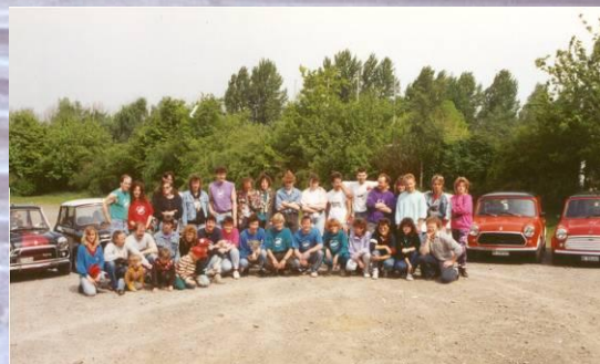
Die grösste Delegation an einem ausländischen IMM (91- Hagen/D)