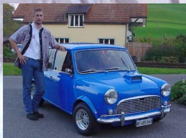
2002 Oliver Spuler Mini 1300