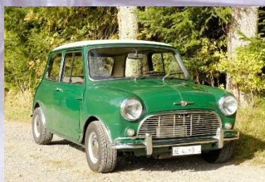
2023 Bernhard Bolognesi Mini Cooper S