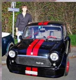
2013 Oliver Spuler Mini Innocenti 1300