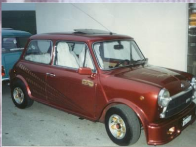
1986 Franz Gabriel Mini Innocenti Cooper 1300