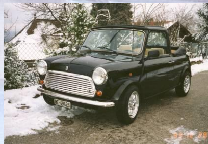
1993 Roland Jäggi Mini 1000 Cabriolet