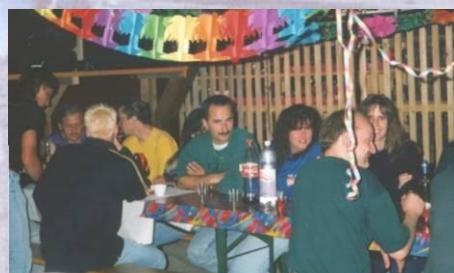
Gemütliches Bräteln am Gruebefest = auf gut Englisch „Minecelebration“