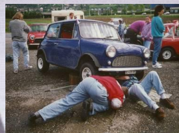
Pannen gibt's, aber selten