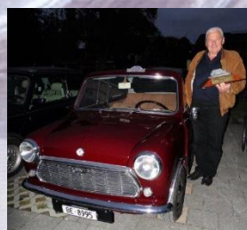
2020 Roland Jäggi Mini 1000 Automat